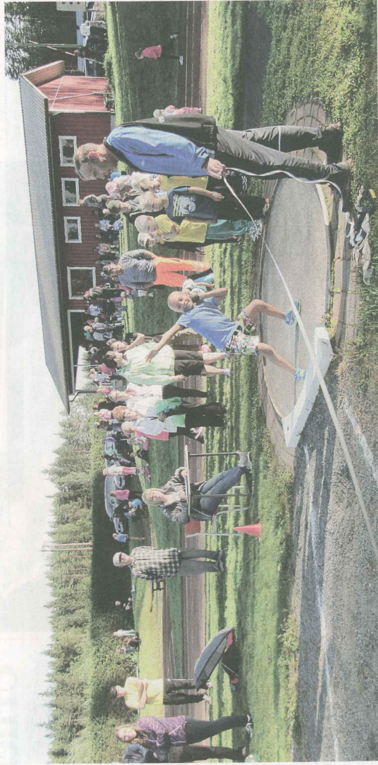
Jyskeessä nuoret ovat tärkeässä roolissa.

Lehtimäkeläisestä hiihdosta puuttuessa nousee esiin aina Val-